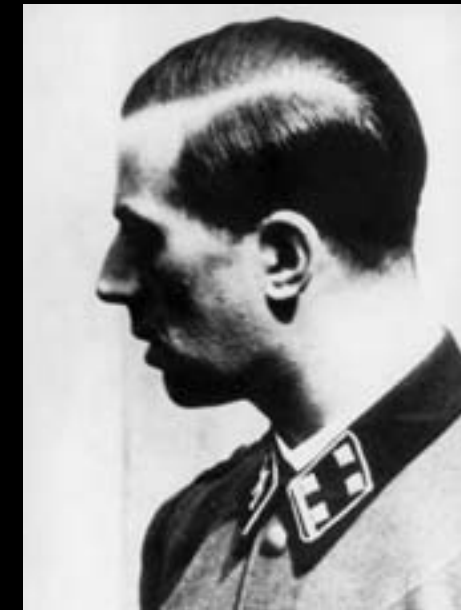
Prof. Dr. med. Karl Brandt (1904-1948), Begleitarzt Hitlers, Generalkommissar für das Sanitäts- und Gesundheitswesen (1942)