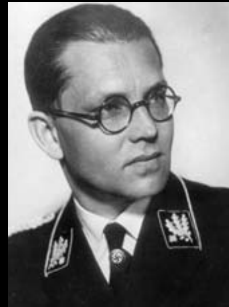
Philipp Bouhler (1899-1945), Leiter der Kanzlei des Führers

Der gesamte Mordprozess, von der Erfassung der Opfer über die Selektion bis hin zu ihrer Ermordung, erhält den Namen „Aktion T4“.